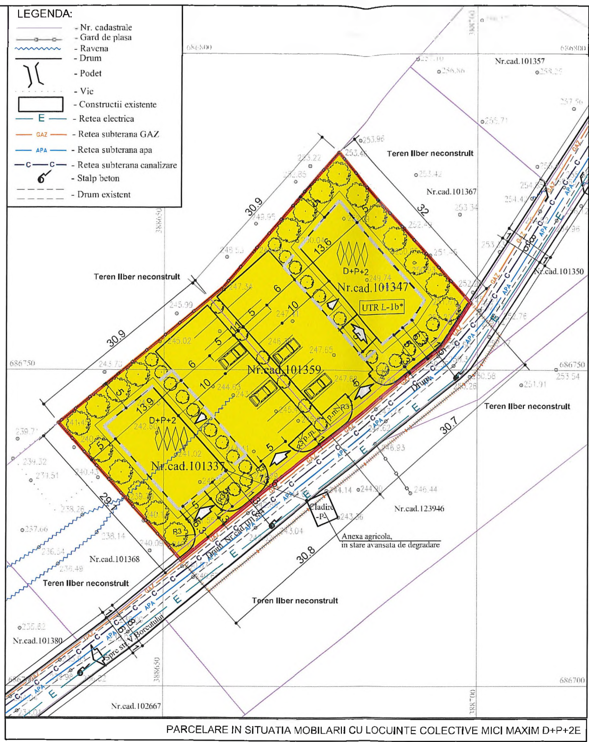
PARCELARE IN SITUATIA MOBILARII CU LOCUINTE COLECTIVE MICI MAXIM D+P+2E